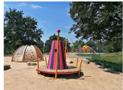
Die Spiellandschaft ist bereits fertig

Machbarkeitsstudie 2018, Planung seit 2019, Realisierung: 2022-2025