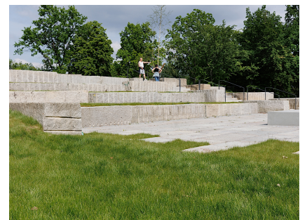
Das Parktheater mit Aussicht über den Park