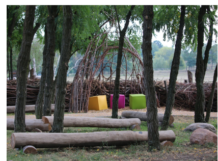
2019 entstanden ein Aktionspfad und ein grünes Klassenzimmer