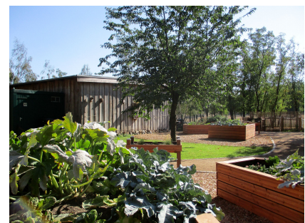
Neue Hochbeete erleichtern das barrierefreie Gärtnern