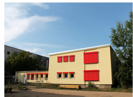
Der sanierte Südwestgiebel mit Sonnenschutz