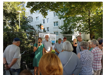
Bürgerinformation zum Baustart im August 2018