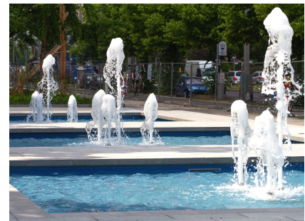
Probelauf der Brunnenanlage Anfang Juni 2019