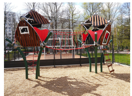
Das Klettergerät "Baumhaus" auf dem neu gestalteten Außengelände des Schülerladens