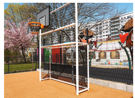
Eines der neuen Bolzplatztore hat einen Basketballaufsatz