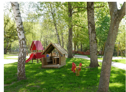
Die Freifläche wurde neu strukturiert und mit zusätzlichen Angeboten aufgewertet