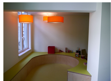
Aus der Küche wurde ein neuer, vielfältig nutzbarer Raum mit Kuschecke