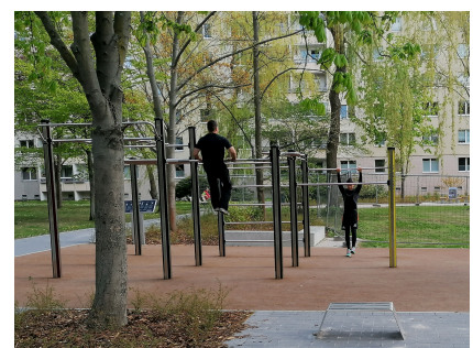
Neu ist u.a. die Calisthenics-Anlage