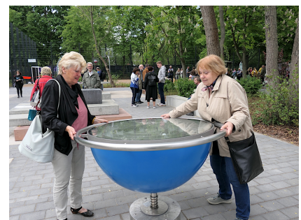
Das Kugellabyrinth erfordert Geschick und Kraft