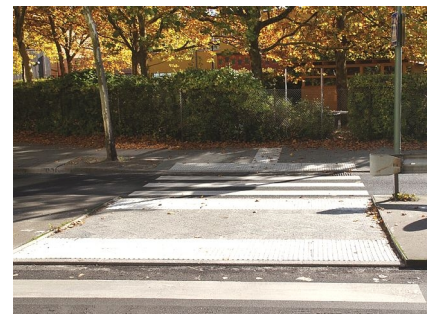
Neuer Fußgängerüberweg an der Treuenbrietzener Straße