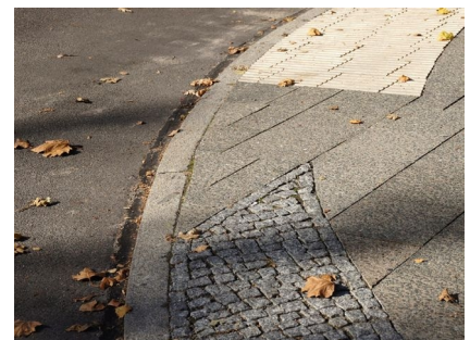
Beispiel einer Bordsteinabsenkung an der Quickborner Straße