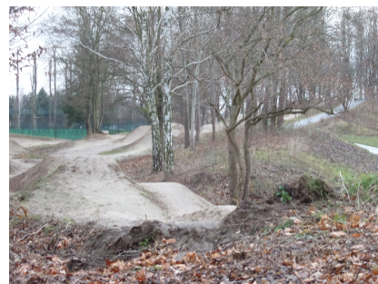
Die fertige Strecke.