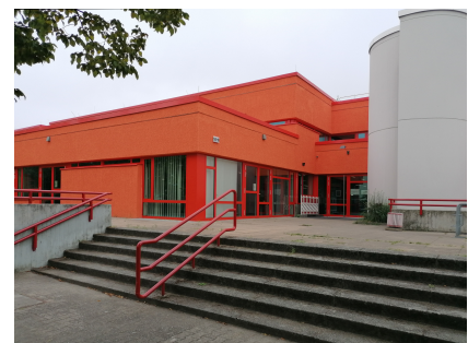
Das comX nach der Sanierung im neuen Farbton