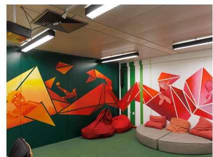
Den Kinoraum gestalteten die Jugendlichen mit.