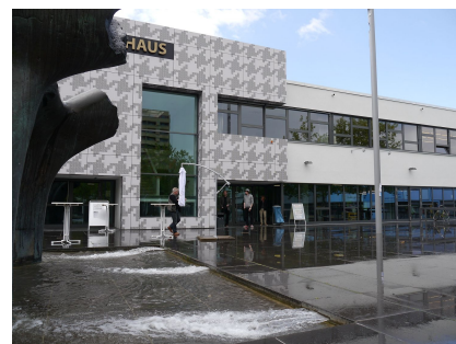
Blick über den Brunnen auf das neue Eingangsportale