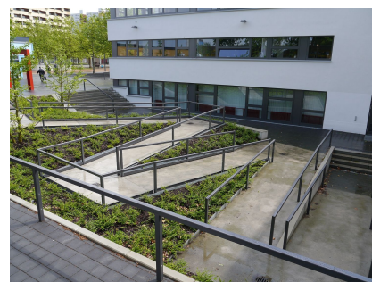
Der separate Eingang zum Bürgeramt im Souterrain