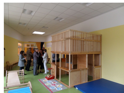
Ein helles, warmes und energieeffizientes Haus für die Kinder