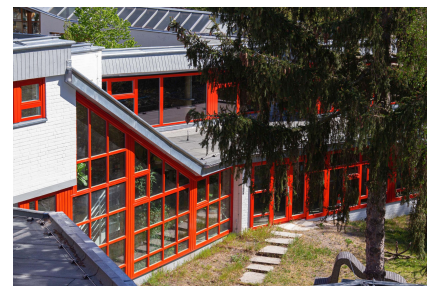
Die Architektursprache der 1960er Jahre ist bei der energetischen Sanierung eine lohnende Herausforderung