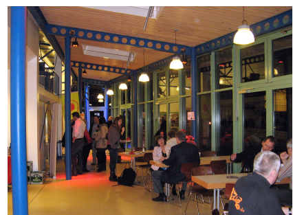
Im neuen Veranstaltungsraum