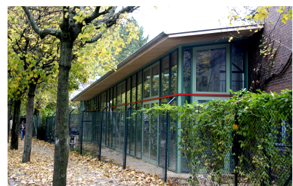
Die erweiterte Kinder- und Jugendhalle