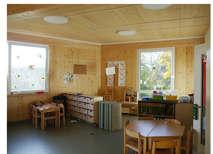
Die unverkleideten Wände veranschaulichen die Bauweise