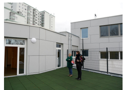
Auf dem neuen Obergeschoss in Holzbauweise können zwei Dachterrassen genutzt werden