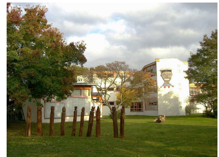
Der Kunstpark 2014