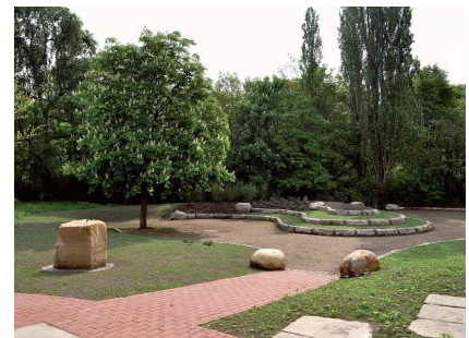
Ein Ort zum Flanieren und Entspannen mit viel Platz für Werke junger Künstlerinnen und Künstler