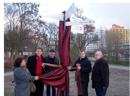
Feierliche Enthüllung im Februar 2016