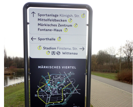
Eines der 11 Informationsschilder