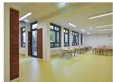
Die Mensa wurde großzügig erweitert