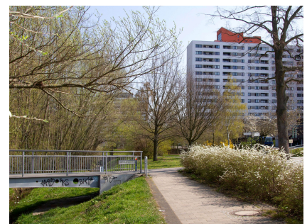
Der Mittelfeldsteg verbindet Zentrum und Sportforum mit dem Park und den Bildungseinrichtungen