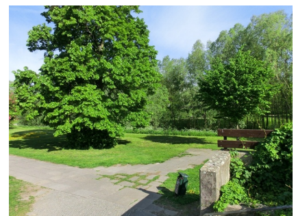
Hier endete bisher der Weg