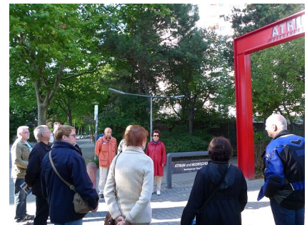
Der Quartiersbeirat besichtigt regelmäßig die laufenden Projekte