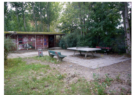
Zustand des Platzes vor der Neugestaltung. Im Hintergrund das marode Holzhaus