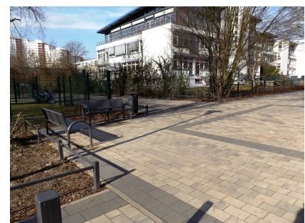
Aufenthaltsplatz am erneuerten Nordzugang zwischen Seniorenzentrum, Oberschule und Mittelfeldbecken