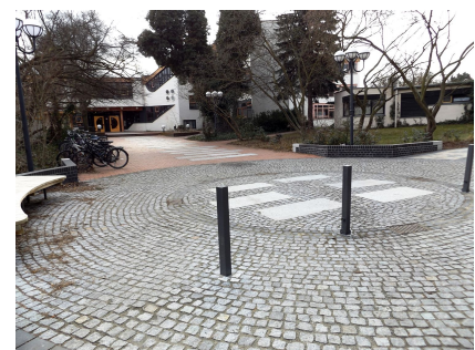
Eingangssituation der Jugendkunstschule Atrium am westlichen Zugang zum Mittelfeld