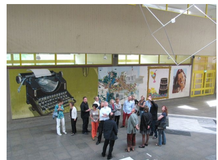
Die zentrale Halle des Gymnasiums ist nun besser isoliert