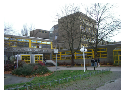
Die Thomas-Mann-Oberschule vor Projektbeginn mit zweigeteiltem Haupteingang