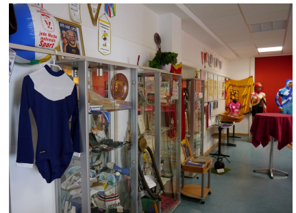
Im Sportmuseum im Erdgeschoss