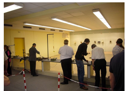
Die Trainingsanlage für Sport-Schützen