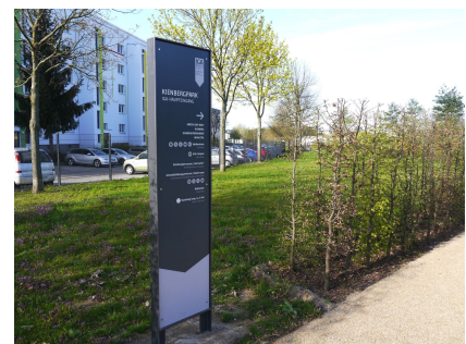
Wegweiserstele am Eingang Kienbergpark