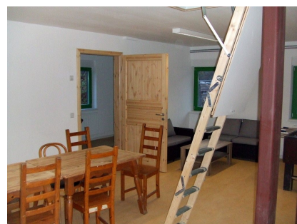
Gemütliche Räume für Spiel und Kreatives bei schlechtem Wetter, Lagerraum auf dem Dachboden