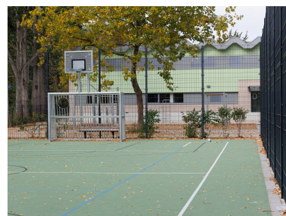
Einer von mehreren neuen Ballspielplätzen