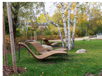
Ein Ort zum Entspannen im Birkenhain