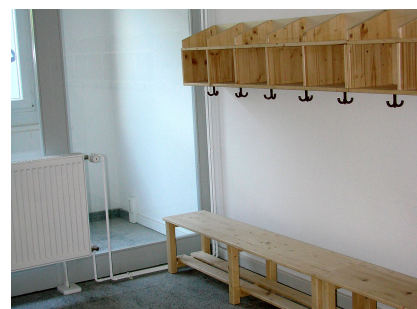
Garderobe für die Kita-Kinder