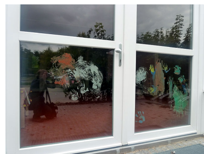
Der Eingang der Kita "Schneckenhausen"

192.000 EUR, davon 142.000 EUR aus dem Programm Stadtumbau Ost, jeweils inkl. Mittel der EU (EFRE)