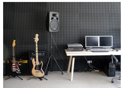
Der Bandprobenraum erhielt eine neue Schalldämmung