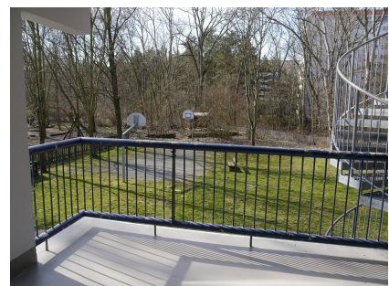
Die Balkone waren durch Feuchtigkeitsschäden bedroht und wurden deshalb saniert