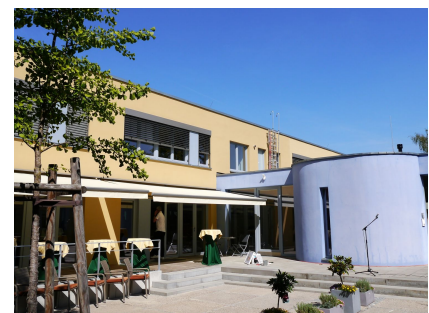
Die neue Caféterrace und der Übergang zur KunstKita ArtKi