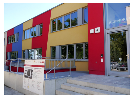
Die Jugendkunstschule wurde innen und außen umgebaut und saniert