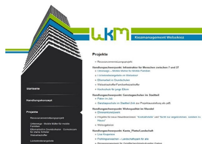
Die Website - wichtiges Kommunikationsmittel für das Kiezmanagement