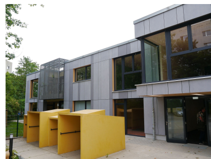
Der Eingang der neuen Kita "Kieke mal"