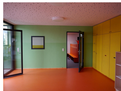
Viel Licht und kräftige Farben in den Innenräumen

Quelle: Independent Living Kindertagesstätten für Berlin gGmbH, Biller und Lang Architekten, bearb. A. Stahl Stand: April 2024