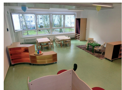
Ein neu eingerichteter Gruppenraum