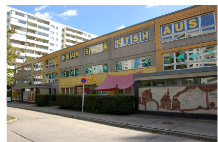
Das Gebäude vor dem Umbau