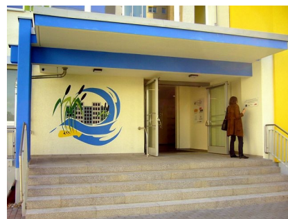
Der Eingang des Nachbarschaftshauses