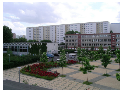
Das frühere Schulgebäude am Bahnhof Wartenberg vor dem Umbau