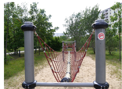
Anspruchsvoller Kletter- und Balancierparcour im Grünen