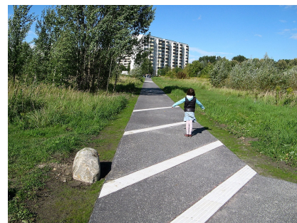
Der Asphaltweg mit Entschleunigungsstreifen