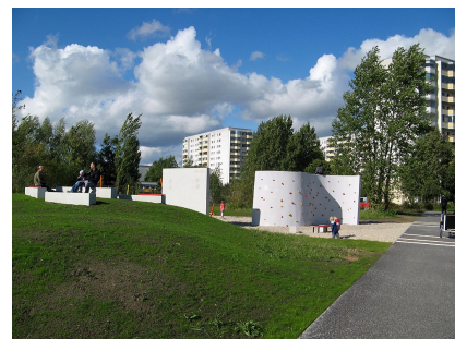
Blick auf die Boulderwände am Zugang Vincent-van-Gogh-Straße