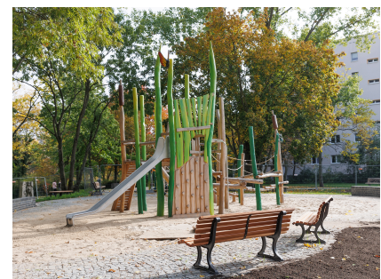
Der neue Spielplatz am Krummen Pfuhl