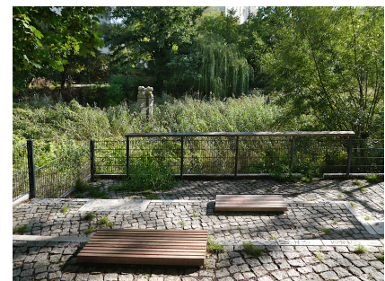
Terrasse mit Blick auf den Teich