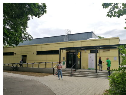
Die sanierte Sporthalle