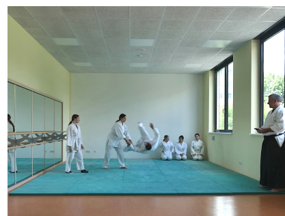
Mehrzweckraum mit Ballettstange und Spiegelwand