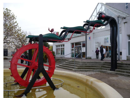
Die Brunnenkunstwerk wurde überarbeitet