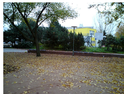
Herbststimmung am erneuerten Stadtplatz