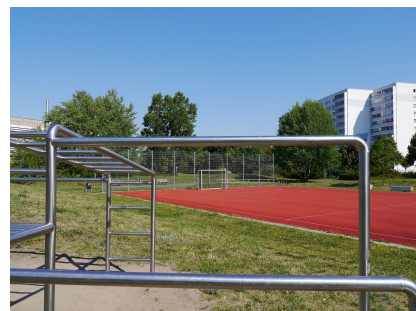
Von den Klettergerüsten aus kann man auch das Spielfeld gut überblicken