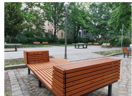
Stadtmöbel für unterschiedliche Bedürfnisse