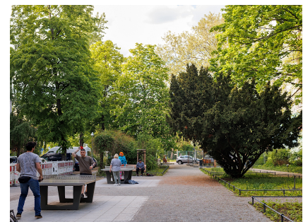
Die neu gestaltete Grünanlage mit Platz für Spiel und Sport