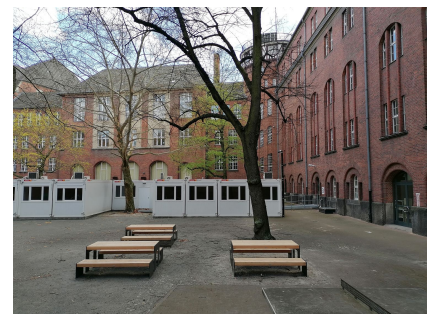
Das neue Mobiliar wurde von Schülerinnen und Schülern ausgewählt