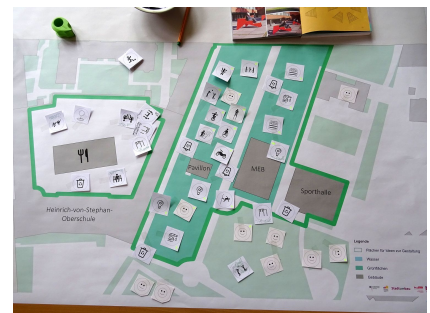
Planungsmaterial aus der Jugendbeteiligung