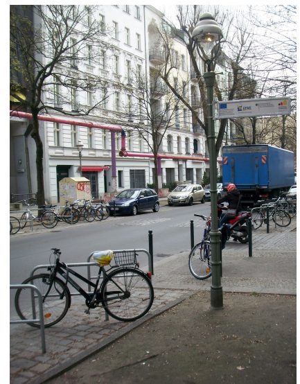
In der verkehrsberuhigten Lehrter Straße wird viel gebaut