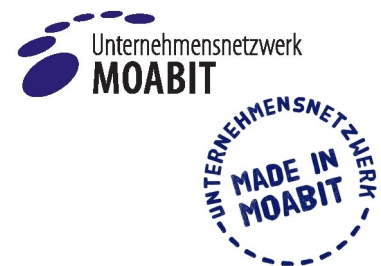
Logo des Unternehmensnetzwerks und der Kampagne "Made in Moabit"