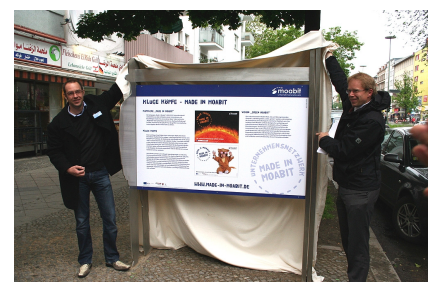
Enthüllung einer Infostele zu "Made in Moabit"