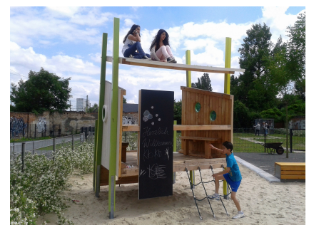
Das Spielhaus mit Maltafel