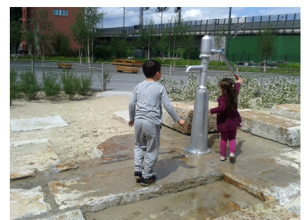
Auf dem Wasserspielplatz wurden Granitblöcke der alten Marmor- und Granitfabrik verarbeitet