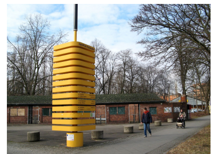
Die Stele am Haupteingang zum Poststadion