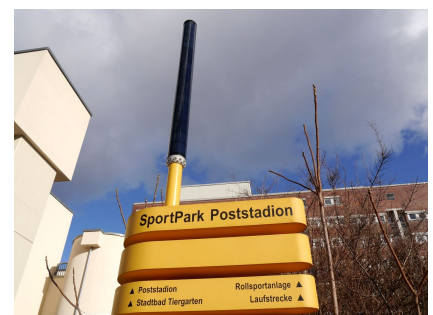
Mit Hilfe von Solarmodulen und LEDs an der Spitze leuchten die Stelen völlig autark im Dunkeln