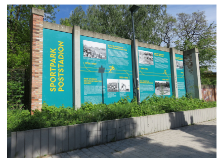
Die Geschichtswand beschreibt die Entwicklung des Sportparks