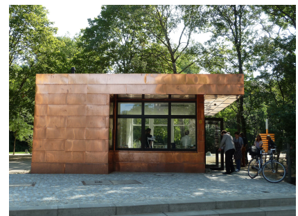
Im Pavillon gibt es kleine Snacks und Toiletten