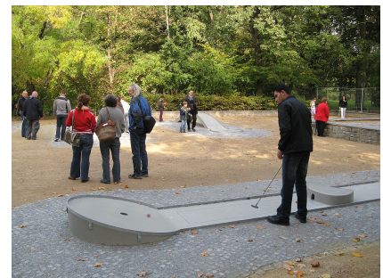
Auf dem Minigolfplatz