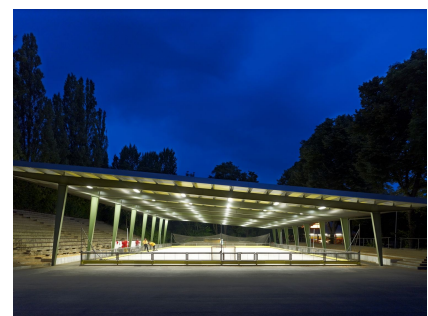
Auch in der Dunkelheit nutzbar und ein besonderer Blickfang - die Rollsportanlage