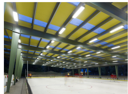
Das schräge Dach mit integrierter Beleuchtung