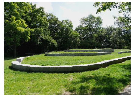
Das Südplateau mit den neuen Rasenterrassen