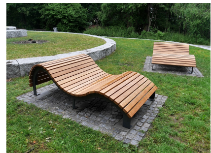
Ein Ort zum Entspannen in der Natur